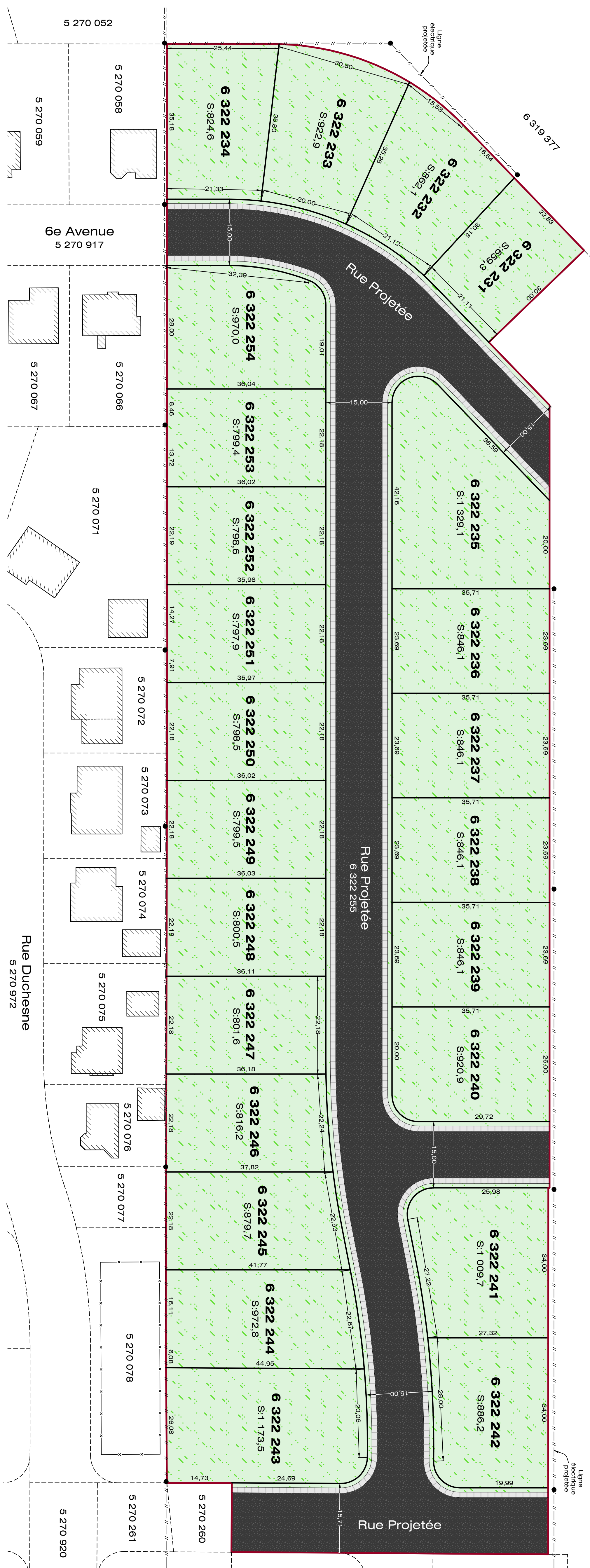
Exemple de terrain aménagé Échelle 1:250

Cadastre du Québec Municipalité: Ville de Métabetchouan-Lac-à-la-Croix Circonscription foncière: Lac-Saint-Jean-Est Échelle: 1:500